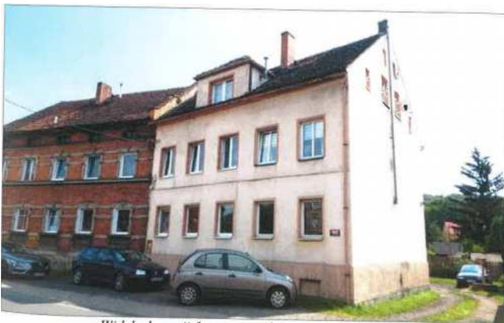
Widok elewacji frontowej – ul. Starolubańska nr 40.

na sprzedaż lokalu mieszkalnego Nr 1, znajdującego się w budynku położonym w Lubaniu przy ul. Starolubańskiej 40 wraz z udziałem we współwłasności nieruchomości gruntowej (działka nr 28/1, AM 19, Obręb II o powierzchni 118 m 2 , JG1L/00026492/3)